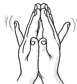
Så Lill möter Lill och det andra står still