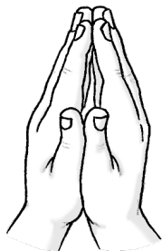
Men det är det ingen annan som vet